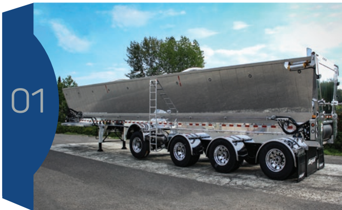
Une photo d'ensemble de la remorque