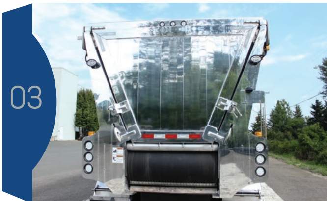
Une photo de la zone générale du problème.